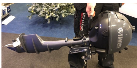
Balance når man bærer motoren