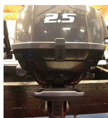
Ultra nem håndtering