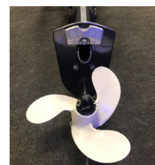
Tov og tang afvisende propel